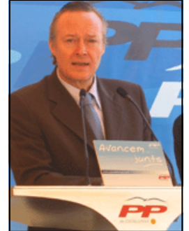
Josep Piqué, President del PPC

Hem participat a la ponència amb lleialtat, fent constar les nostres aproximacions i demanant, com no pot ser d'una altra manera, que la reforma de l'Estatut es fes en el marc de la Constitució i amb voluntat de consens. Defensar la Constitució no és altra cosa que defensar "l'imperi de la llei", que és l'única garantia de la llibertat i la democràcia. El nostre vot particular a la totalitat del text es basa en els següents fonaments: