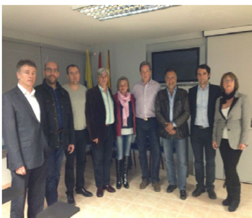
Miembros de la nueva Junta Comarcal del PP