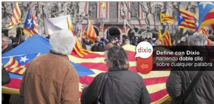
Manifestantes independentistas en Barcelona el 23 de enero

De la insumisión fiscal a asesorar sobre la ilegalidad