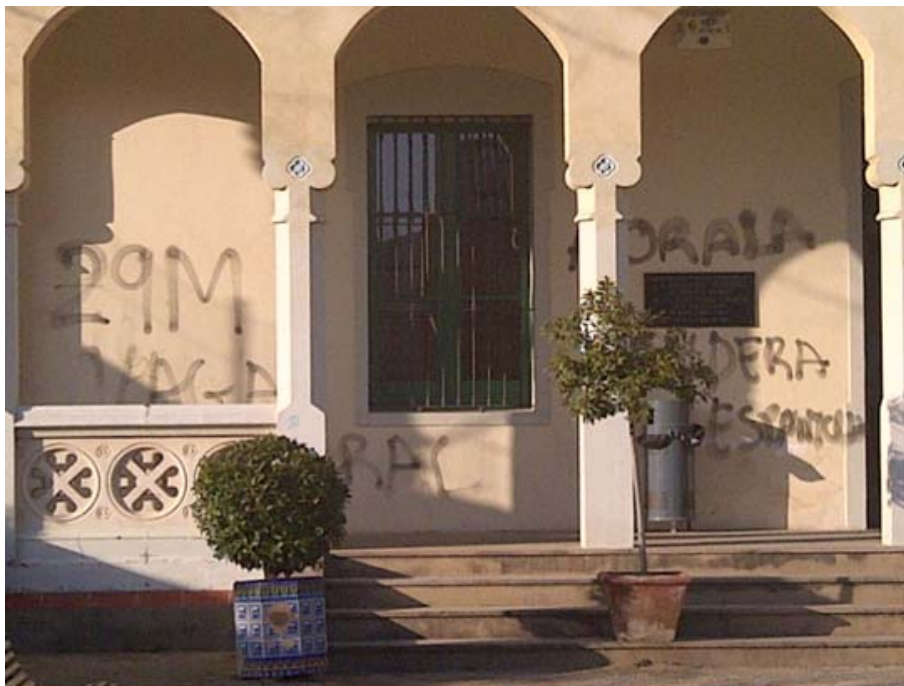
> En la imagen, la bandera española quemada y las pintadas en la fachada del Ayuntamiento