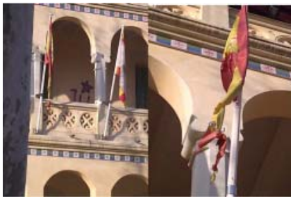
Estat en què va quedar la bandera espanyola de Begues després de ser cremada

Primer va ser la bandera espanyola de Sant Pol de Mar (Maresme), que va ser cremada després que la delegació del govern espanyol anunciés una persecució legal contra els ajuntaments que no complissin amb la Llei de Banderes espanyola.